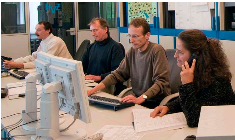
Die Abflussvorhersagen werden laufend auf einen gemeinsamen Internetserver übertragen.

Die von den Hochwasserzentralen erstellten Abflussvorhersagen für die Bodenseezuflüsse werden laufend auf einen gemeinsamen Bodensee-Internetserver übertragen. Ein von der Hochwasservorhersagezentrale Baden-Württemberg entwickeltes hydrologisches Modell berechnet anhand der Zuflüsse, des Niederschlags auf den See sowie der hydraulischen Bedingungen die Wasserstände im Ober- und Untersee sowie die Abflüsse in den See- bzw. Hochrhein. Weil die drei Länder den Wasserstand in unterschiedlichen Höhenbezugssystemen angeben, werden für den Obersee Vorhersagen für die Pegel Konstanz (D), Bregenz (A) und Romanshorn (CH) bereit gestellt. Für den Untersee gibt es Vorhersagen für die Pegel Berlingen (CH) und Radolfzell (D).